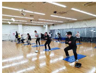
生活習慣病改善プロジェクト「健幸くらす」