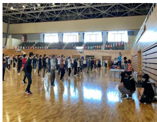
オータムフェスタと測定ブース