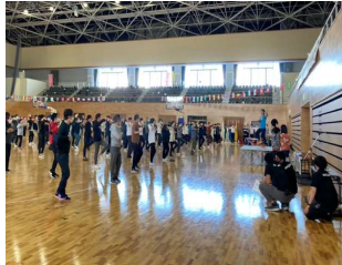
オータムフェスタと測定ブース

※3 ユトレヒト・ワーク・エンゲージメントの尺度の活力・熱意・没頭に関する設問17問(最低0点～6点で、高得点ほど良好な状態を表す)の平均点