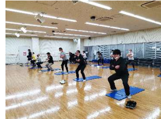
生活習慣病改善プロジェクト「健幸くらす」