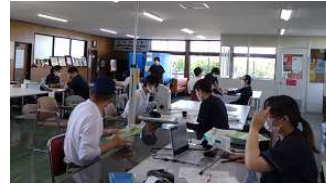
各種健康セミナー 集合研修方式にて 受講促進